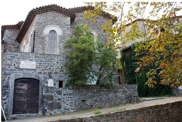
Musée du Désert